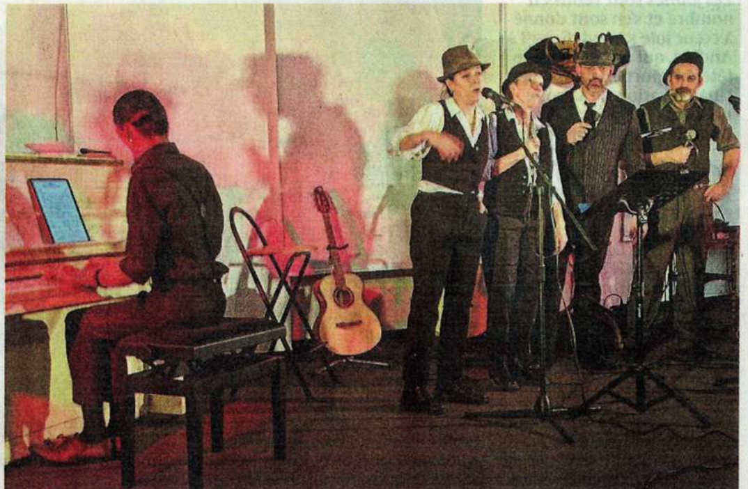
Le Gang des chanteurs de Barr'seille, avec ses chansons de crimes et d'assassinats, a fait salle comble samedi soir.

Idem samedi après-midi pour Jean-Pierre Schackis, ancien